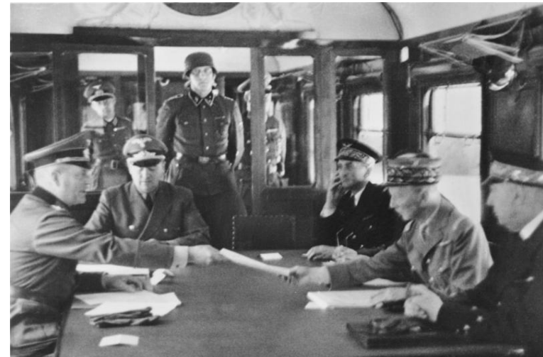
22. Juni 1940

Le général Charles Huntziger, le chef de la délégation française, signe l'armistice dans la forêt de Compiègne, à Rethondes, dans le même wagon où avait été signé l'armistice allemand le 11 novembre 1918. C'est Joseph Goebbels qui a choisi l'endroit, pour effacer l'"humiliation". Cet armistice met un terme à la participation de la France au conflit et fait du nord du pays une zone sous occupation allemande.