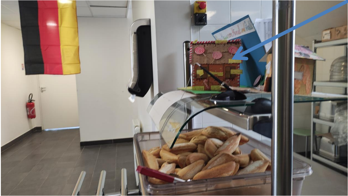
Das Haus von Hänsel und Gretel. La maison d'Hänsel et Gretel.