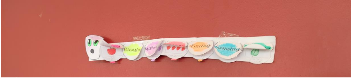
Die kleine Raupe Nimmersatt (La petite chenille qui fait des trous. )