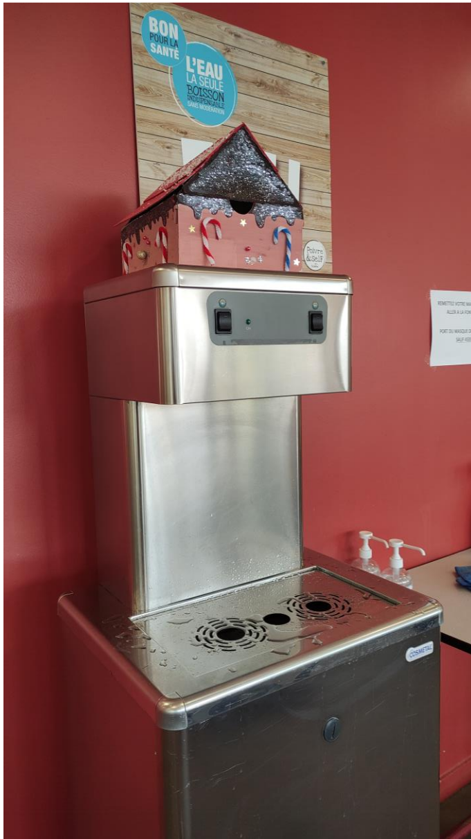
Das Haus von Hänsel und Gretel. La maison d'Hänsel et Gretel.