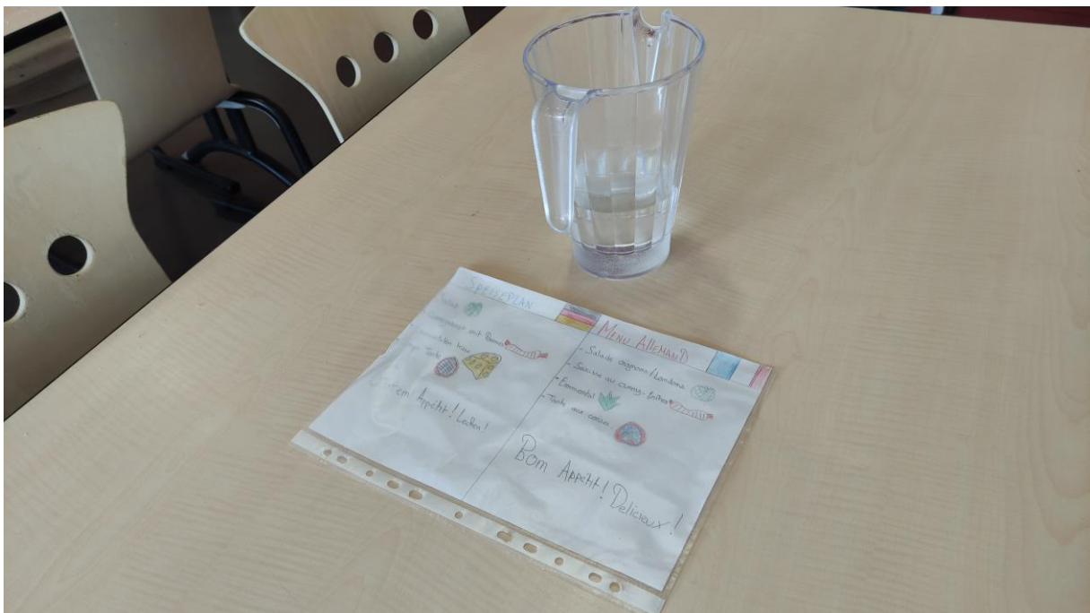
Des menus étaient posés sur les tables.