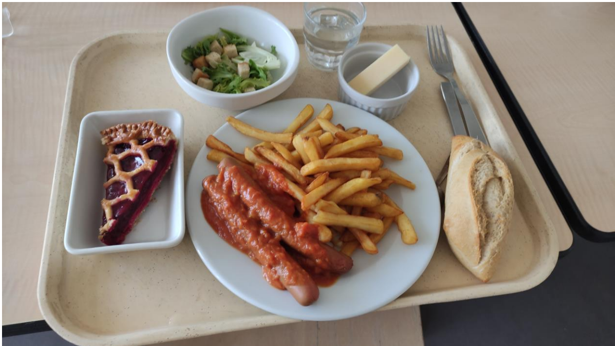
Le repas du lundi 16 mai.